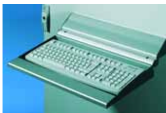
Anbau an Flächen